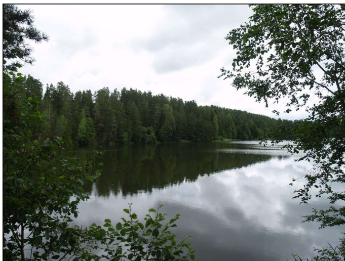
Trukšānu pilskalns II - priekšplānā, Trukšānu pilskalns I - aiz tā.

Pilskalni atrodas viens otram līdzās Ludzas jeb Ilzas upes kreisajā krastā, aptuveni ziemeļrietumu rietumu – dienvidaustrumu austrumu virzienā orientētā kauprē starp Lielo Trukšānu, Morozovkas un Tumovas sādžām ap 700 m uz ziemeļrietumiem no Felicianovas. Minētā kaupre paceļoties un nolaižoties turpinās vairāku desmitu kilometru garumā, un tajā dažādās vietās atrodas vairākas labi zināmas senvietas: (no rietumiem uz austrumiem) Ludzas viduslaiku pils, Ludzas Odukulns – senkapi, Jurizdikas pilskalns, Jurizdikas akmens laikmeta apmetnes Jurizdikas ragā, Ciblas Ķīšukalns – pilskalns ar plašu senpilsētu, Ciblas Kapu kalns – pilskalns, Cib-